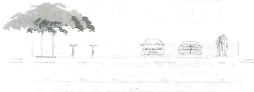
Imagen Vía tipo Anillo Veredal, caso 4.

Sección vial: - Andén: ..... 1.80 m. - Calzada vehicular: ..... 7.50 m. - Ciclorruta: ..... 5.00 m. - Franja Ambiental: ..... 1.70 m. Total sección vial: ..... 16.00 m.