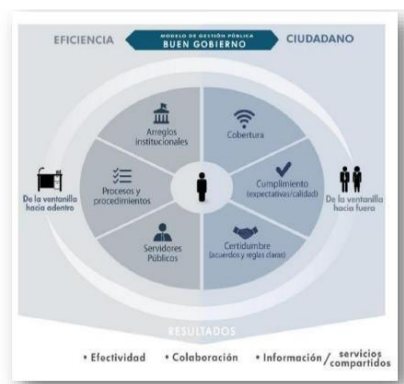
Ilustración 1. Modelo de Gestión Públicas Buen Gobierno