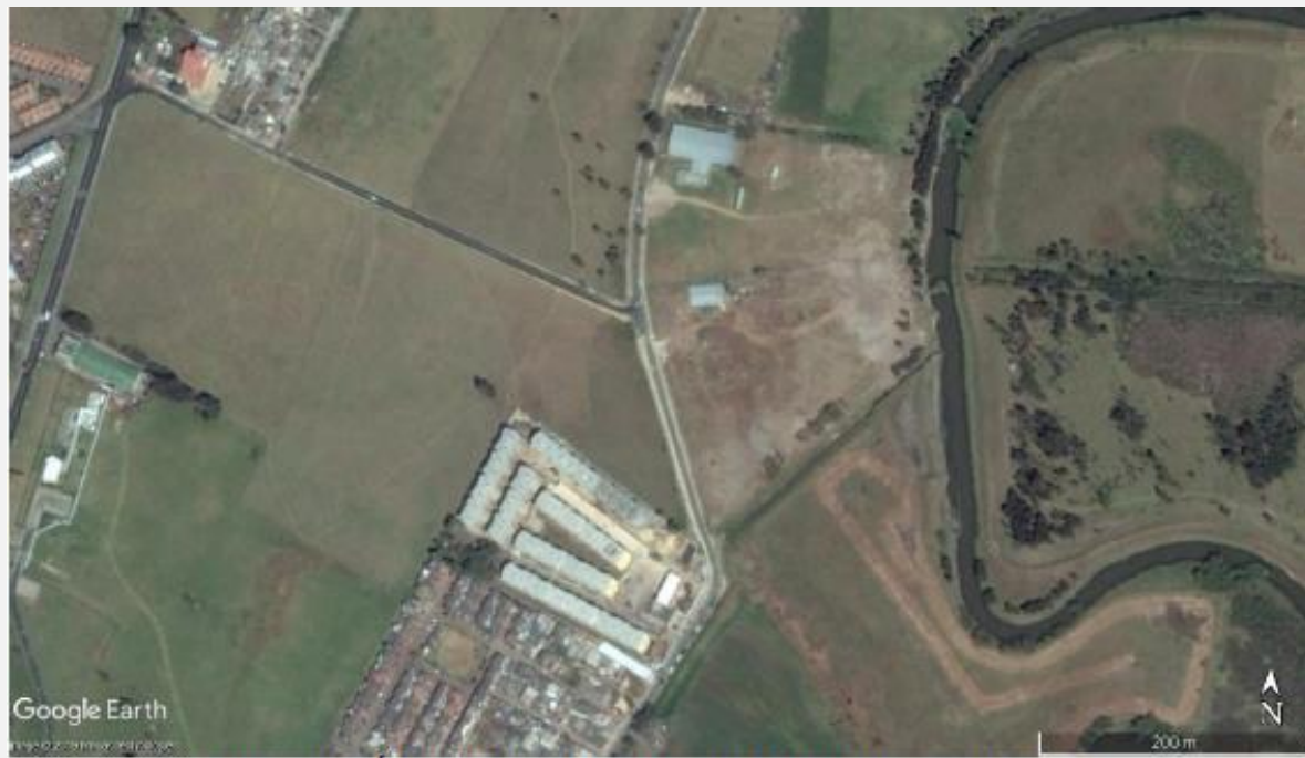
Imagen 7. Área de interés año 2016.