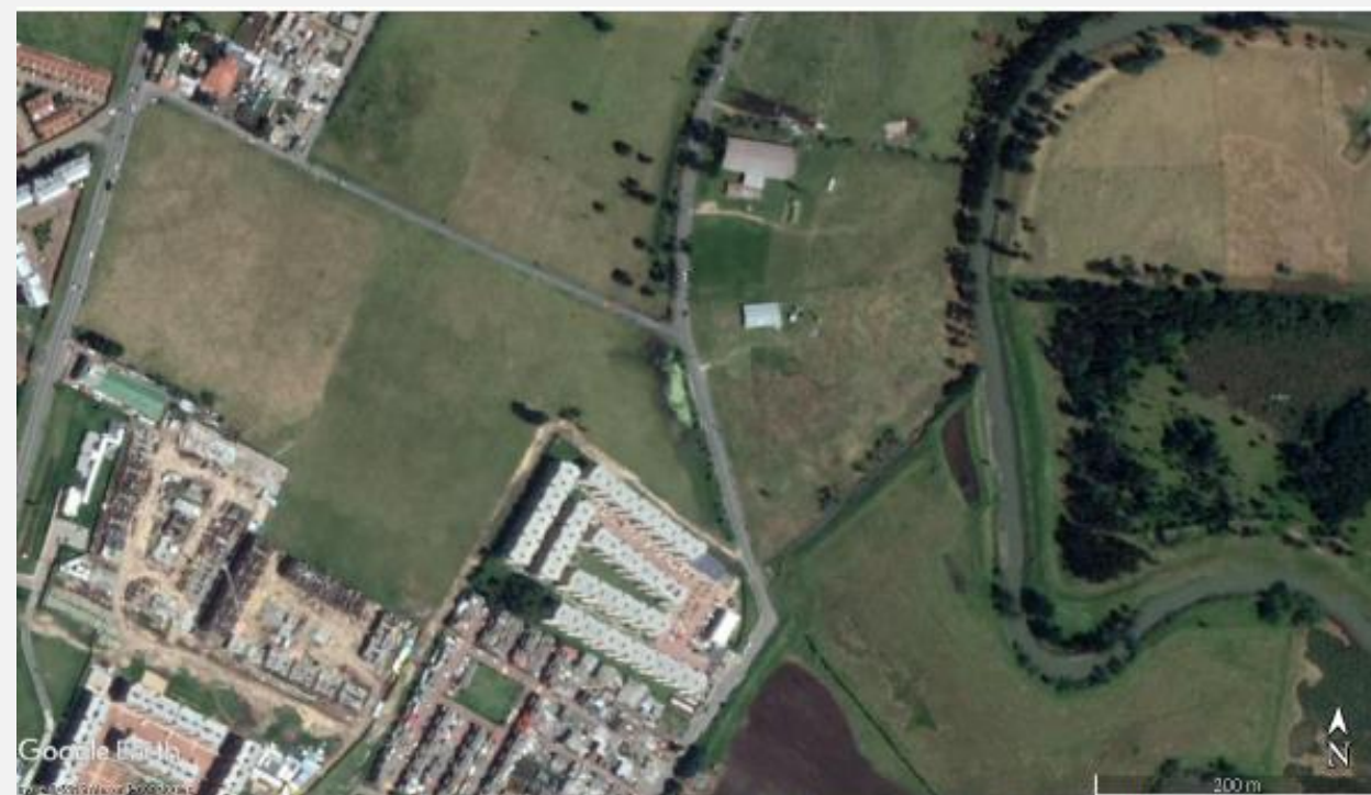
Imagen 8. Área de interés año 2019.