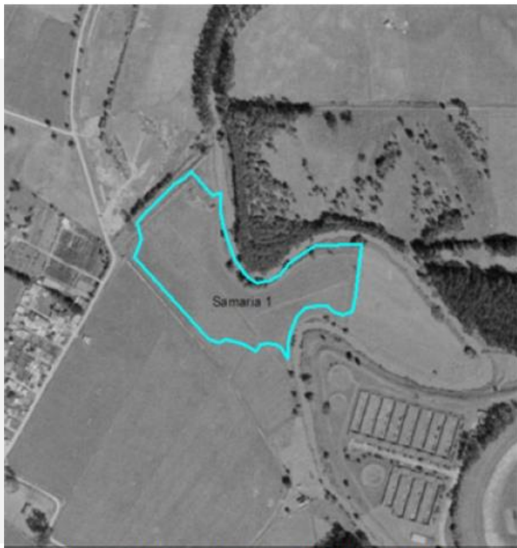
Imagen 4. Fotografía area 1993.