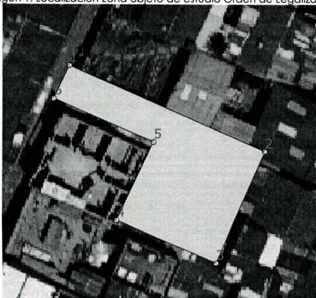
Imagen 1. Localización Zona objeto de estudio Orden de Legalización.