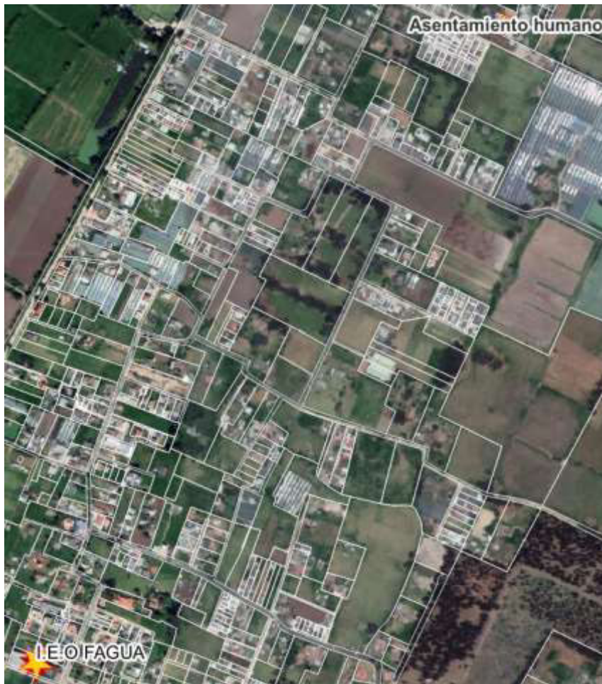
Déficit de equipamientos educativos y espacio público respecto al asentamiento humano.

El predio se localiza en la parte alta del sector de Chiquilinda en la vereda de Fagua, con un polígono que tiene un área aproximada de 647 m 2 . En este sector se evidencia la ausencia o deficiencia cuanto, a equipamientos y a espacios públicos, ya que el equipamiento más cercano es la Institución Educativa Oficial de Fagua, la cual brinda educación primaria y básica encontrándose aproximadamente a 1350 m aproximadamente.