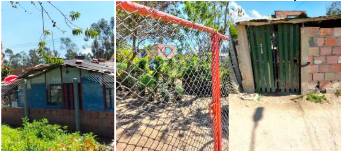
Imagen 2. Características predominantes del asentamiento humano