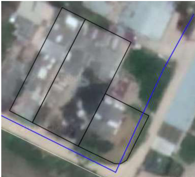
Ilustración 2. Red existente de acueducto en la zona objeto de estudio

Conforme a la información recopilada en el marco del Plan maestro de Acueducto y Alcantarillado 2018, se tiene a nivel de acueducto un suministro por el camino a la vereda Fagua, sector Chiquilinda, por una tubería de 2" diámetro en material PVC.