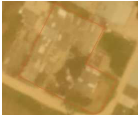
Ilustración 1. Amenaza por inundación para la zona objeto de estudio.