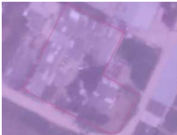
Ilustración 2. Zonificación y categoría de uso de acuerdo al POMCA del Río Bogotá.