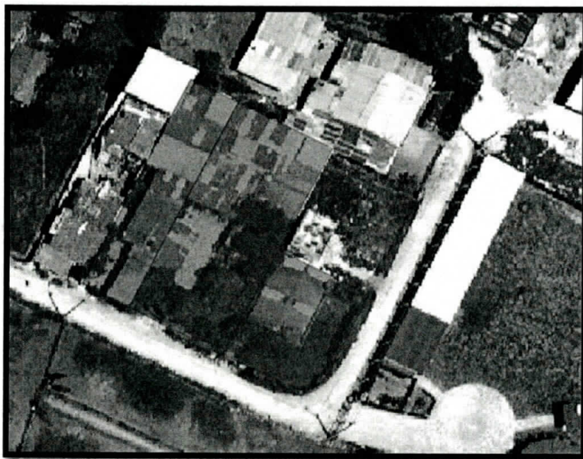
Ilustración. Ámbito del Asentamiento Humano.

PARÁGRAFO PRIMERO. - No siendo posible el trámite de legalización urbanística a nivel de ámbito, se procederá en segunda medida a que se sometán mediante un único proceso, un número plural de lotes del asentamiento humano.