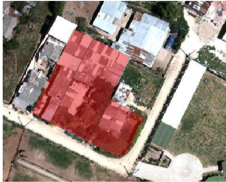
Ilustración 1. Ámbito Asentamiento Humano