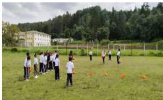
Institución Educativa Fusca