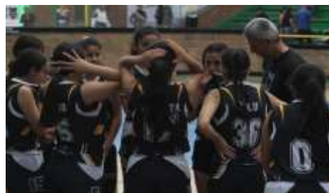
Campeonato de Baloncesto.