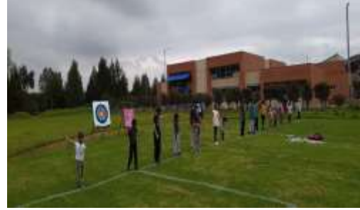
Tiro con arco