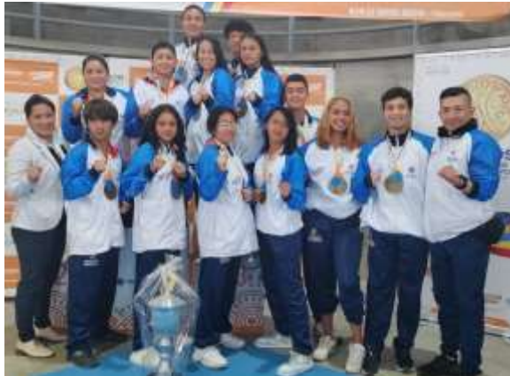
Campeonato de Taekwondo