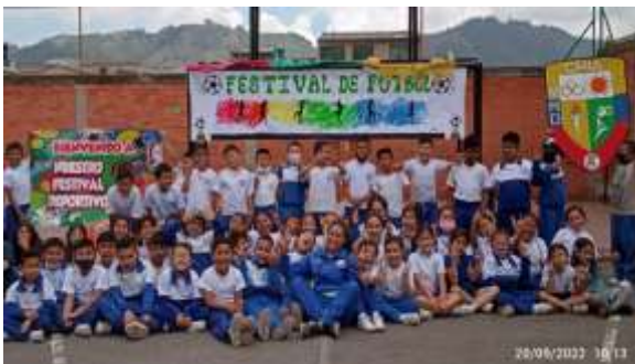
Institución Educativa CONALDI

Trimestre III: El IMRD ha logrado engranar el trabajo en las instituciones educativas con un equipo interdisciplinario de psicología y trabajo social, el cual ha tenido gran acogida dado que los niños se sienten con mayor motivación para vincularse a los diferentes deportes, sin ningún tipo de restricción. Logrando a su vez, transformar sus condiciones sociales y sus barreras emocionales. En lo corrido del 2022 se tienen 6570 beneficiarios de los cuales el