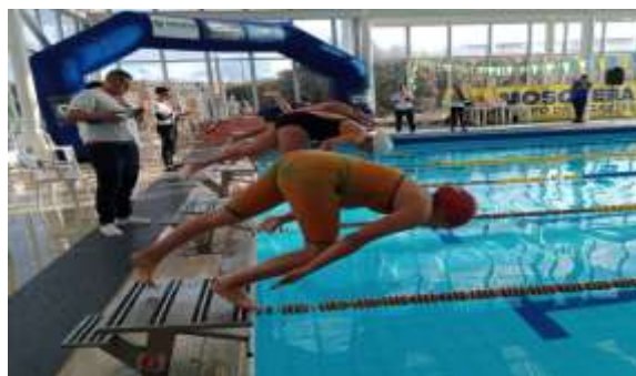
Campeonato de Natación

Los eventos son una demostración y/o exhibición donde se muestra a la comunidad los avances de las diferentes escuelas de formación que brinda el IMRD, también se busca ser centro o sede de la zona o el departamento para desarrollar eventos de carácter departamental, nacional e internacional para que el municipio pueda crecer en el ámbito económicos, social, creativo-deportivo, turístico, hotelero y demás, también se busca tener un apoyo en las diferentes Juntas de Acción Comunal del municipio, buscando generar espacios para la práctica deportiva y evitar el sedentarismo y consumo de sustancias alucinógenas. Estos eventos buscan promover la participación de la comunidad en todas las veredas. En los diferentes eventos se cuenta con un total 12.300 usuarios de los cuales el 65% es del género Femenino con (7.991), y el 35% restante corresponde al género Masculino con (4.309 usuarios).