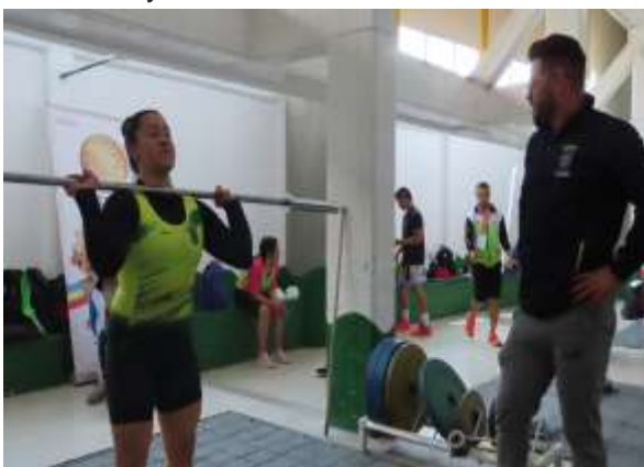
Campeonato de Pesas

Cabe resaltar que en las actividades masivas la participación del género femeninos mayor que la participación de género masculino Desagregado de la siguiente manera en el ciclo vital de vida. En primera infancia con el 7% seguido de Infancia con el 20% continuamos con adolescencia con el 31%, juventud con el 22%, adulto con el 12% y terminamos con adulto mayor con el 8%.