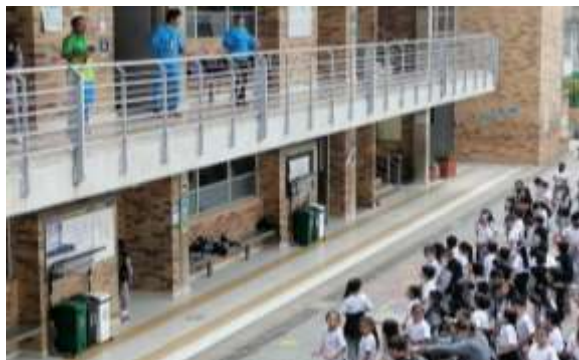
Institución Educativa Laura Vicuña