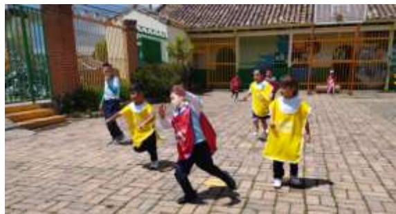
Institución Educativa La Balsa

estos procesos de iniciación y fundamentación para forjar el proceso deportivo a mediano y largo plazo, por medio de procesos de enseñanza y aprendizaje de la metodología, los contenidos, las bases teóricas, técnicas, tácticas y los valores olímpicos en el desarrollo integral del niño, evidenciado y desarrollado desde el juego, la alegría y el amor al deporte y la actividad física.