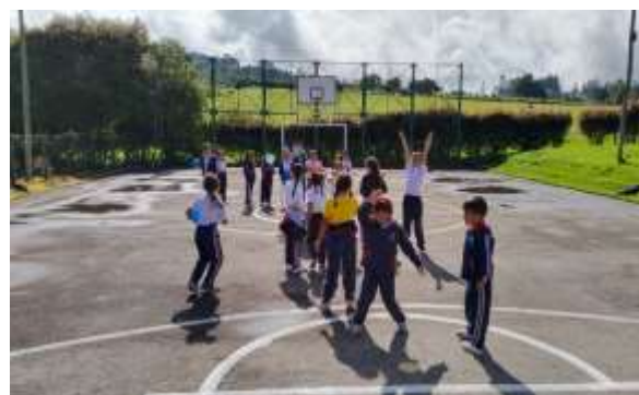
Institución Educativa Yerbabuena

• Motivadora: buscando generar el hábito de la actividad física como fuente de satisfacción, el aprovechamiento del tiempo libre y la práctica deportiva como desarrollo integral del niño; además del conocimiento y fortalecimiento de los valores olímpicos, sociales y deportivos en el desarrollo de la JEC y los CID irradiados en las Instituciones educativas oficiales del municipio de Chía.