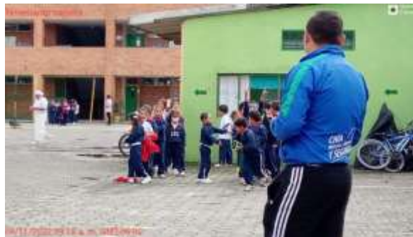
Institución Educativa José Joaquín Casas

Objetivo General Implementar en las instituciones educativas oficiales del municipio de Chía un plan deportivo enfocado en el aprovechamiento de la educación física, la recreación, el deporte y la utilización del tiempo libre en la jornada escolar complementaria.