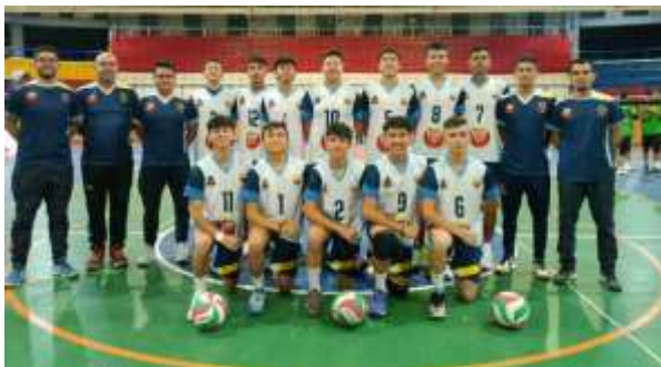
Campeonato de Voleibol

corrido del año se han desarrollado 97 eventos.