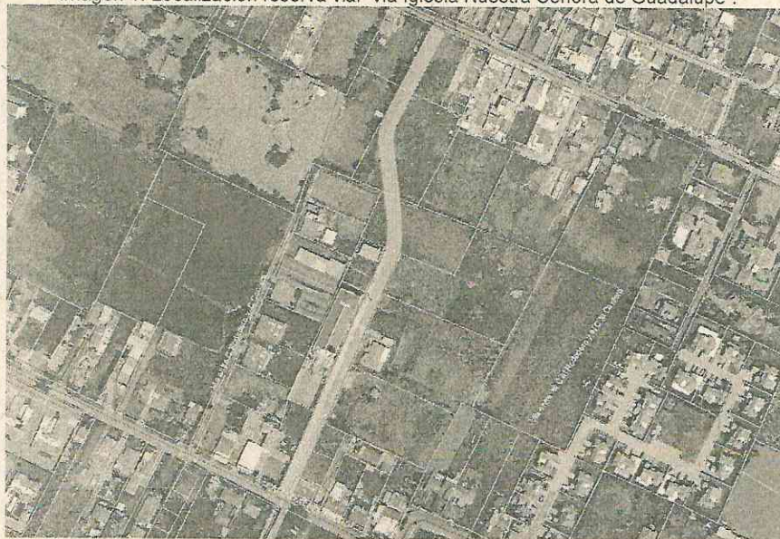
Imagen 1. Localización reserva vial "vía Iglesia Nuestra Señora de Guadalupe".

El área de reserva vial sobre áreas privadas, el espacio público que conforma el proyecto y el área resultante privada de los inmuebles, se determina tal como se puede observar en la siguiente imagen: