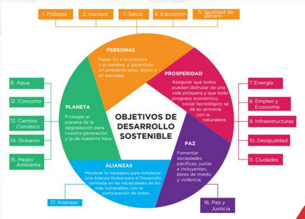
Objetivos de Desarrollo Sostenible- ODS 2030

En este orden de ideas, agrupamos todas nuestras propuestas en los cinco ejes de desarrollo sostenible: Personas, Prosperidad, Paz, Planeta y Alianzas. Las cuales, serán nuestro pilar y guía para el cumplimiento de todas nuestras metas desde el primer día de gobierno, para así generar un interés en querer seguir replicando este modelo para que se pueda lograr una Chía mejor tanto presente como futura.