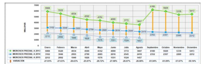
Tabla 2. Gestión de Cartera en la Disminución de Deudores Morosos

Como consecuencia de la cartera morosa y en concordancia con el reporte del diagnóstico inicial, se evidencio la suscripción de 277 facilidades de pago de las vigencias 2012 y/o anteriores, los cuales se encontraban incumplidos, situación que obligo al Grupo de Ejecuciones Fiscales a revocar los acuerdo de pago y reanudar el proceso de cobro coactivo, haciendo efectivas las garantías denunciadas por el contribuyente, cumpliendo con el objetivo principal de la Jurisdicción Coactiva de recaudar de manera forzada el pago de las obligaciones fiscales adeudas al Municipio.